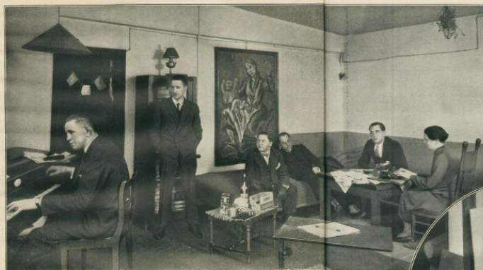
Der Diktator Bert Brecht bei der Arbeit

Bert Brecht (der an Słowak Iwan) scheint uns zu dieser Aufnahme. Ein Bild ausstanzungskriegs, aus dem ablesen, so viele kleine Widersprüche sind man sagen eine Arbeitssession haben, die fotografiert haben von Arbeit und Photographiertwerden oft aber unter einem Hut zu bringen. Ich selber arbeite zusammen, ließ aber den Photographen zu einer Zeit kommen, wo ich das Zimmer voll hatte, wenn auch nicht zu unserer Erwartung und ich mich erweilte, daß unsere unmittelbare Haltung auf unsere Entschluß bei an zu tun, als wägen wir, daß wir fotografiert werden.